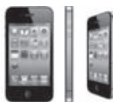
Samsung Galaxy X2 SPECIAL PRICE